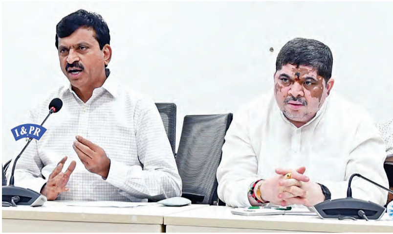
సోమవారం కేబినెట్ నిర్ణయాలను వెల్లడిస్తున్న మంత్రులు పొంగులేటి, పాన్నం

ఎపి యత్నాలను అడ్డుకునేందుకు న్యాయ, చట్టపరమైన చర్యలు • జులై మొదటివారంలో సిఎల్పీ సమావేశం, పవన్ పాయింట్ ప్రజెంటేషన్ • 201 కి.మీ. మేర ఆర్ఆర్ఆర్ నిర్మాణం • ప్రతి జిల్లా కలెక్టరేట్లో తెలంగాణ తల్లి విగ్రహం, డిసెంబర్ 9న ఆవిష్కరణ • అపరిష్కృతంగా ఉన్న అంశాలపై 2 రాష్ట్రాల అధికారుల కమిటీ సమావేశం • పిసి ఫోర్షకు పూర్తి వివరాలను అందించే బాధ్యత అధికారులకు అప్పగించ • సాఫ్ట్వేర్ పాలసీకి ఆమోదం • ప్రతి నెల రెండుసార్లు కేబినెట్ భేటీ, మూడు నెలలకొకసారి ప్రత్యేక భేటీ • కేబినెట్ నిర్ణయాలు వెల్లడించిన మంత్రులు పొంగులేటి, పాన్నం, శ్రీవారి